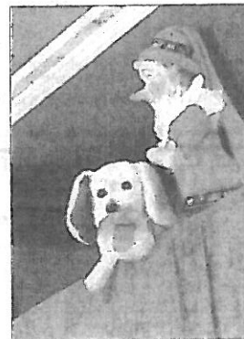
Stars der Kinder: Kasper und sein Freund Bello.