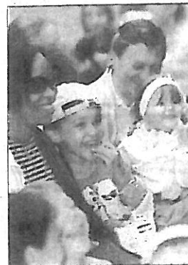
Auch die Älteren hatten an diesem Nachmittag ihren Spaß.

Die Familienparty fand im Rahmen der NWZ-Aktion „Hier bin ich zu Hause“ statt, die in dieser Woche die Lebensqualität in Eislingen in der Tageszeitung in den Mittelpunkt rückt. Die Leser sind dabei aufgefordert, per Coupon ihre Stadt zu bewerten. In der kommenden Woche dreht sich alles um die Stadt Süßen. Die Familienparty geht deshalb am kommenden Donnerstag ab 15 Uhr auf der Wiese beim Bürgerhaus über die Bühne.