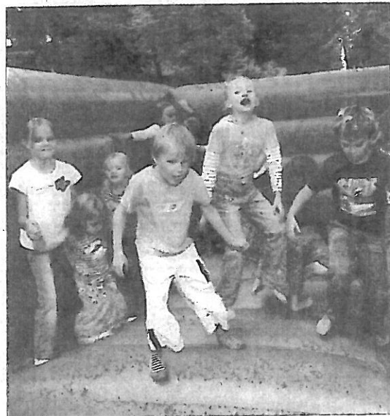
Natürlich war auch die Hüpfburg wieder der Renner bei den jungen Besuchern der NWZ-Familienparty.