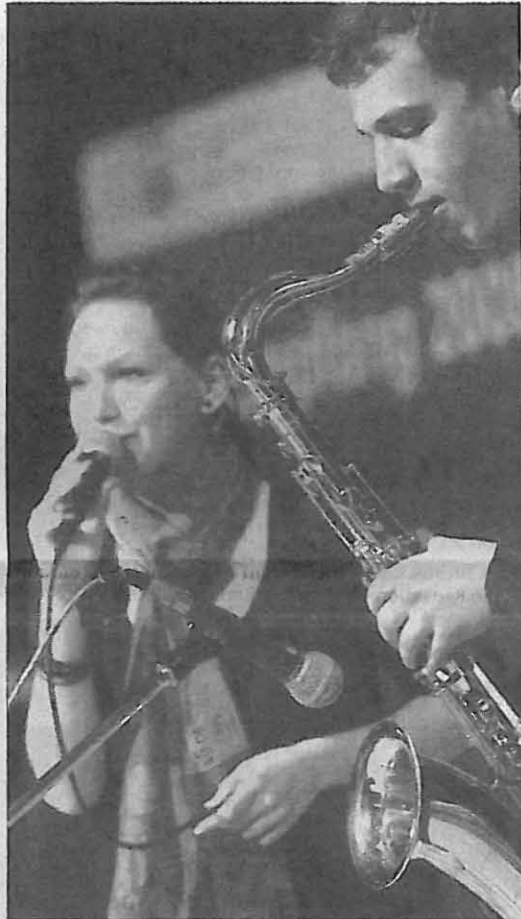
Das Jugendmusikschul-Ensemble „Jazzico“, Preisträger im Landgend jazzt“, unterhielt die Gäste beim IHK-Empfang.